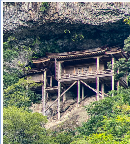
三徳山三佛寺投入堂