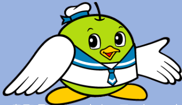
鳥取県マスコットキャラクター トルピー