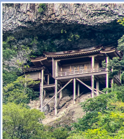
三徳山三佛寺投入堂