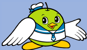
鳥取県マスコットキャラクター トルピー